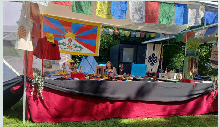
TSG-afdeling Friesland tijdens het Love & Light Festival, juni 2025

Bij de infostand van TSG NL konden bezoekers informatie over Tibet krijgen en een ruime selectie artikelen uit de Tibetwinkel bekijken. Het viel op dat veel bezoekers nog weinig wisten over de situatie in Tibet; zij lieten zich graag informeren. Een enkele bezoeker was terughoudender, omdat hij van plan was Tibet te bezoeken.