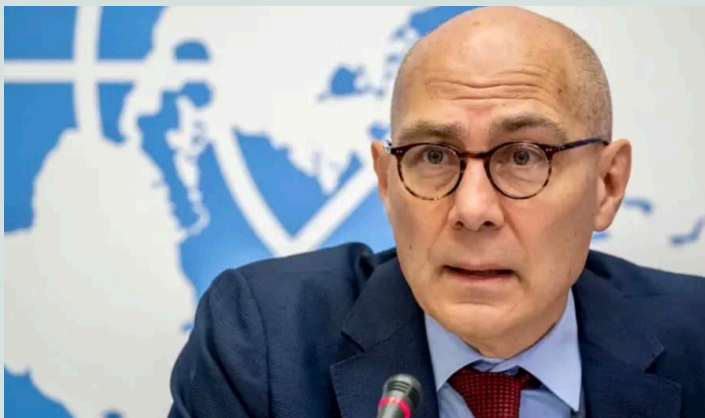
VN-Hoge Commissaris voor de Mensenrechten Volker Türk

Tijdens de 58e zitting van de Raad sprak de EU haar diepe bezorgdheid uit over de situatie in Tibet. Daarbij werd onder meer gewezen op de gedwongen kostscholen, de beperkingen op de vrijheid van religie en meningsuiting, en de willekeurige detentie van Tibetaanse mensenrechtenverdedigers. Samen met andere Tibetorganisaties pleitte de Tibet Support Groep actief bij de VN. Zij riep de Nederlandse regering en de internationale gemeenschap op om China verantwoordelijk te houden voor de culturele genocide in Tibet.