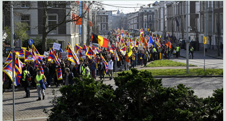
Mars door Den Haag tijdens manifestatie van 10 maart 2025.