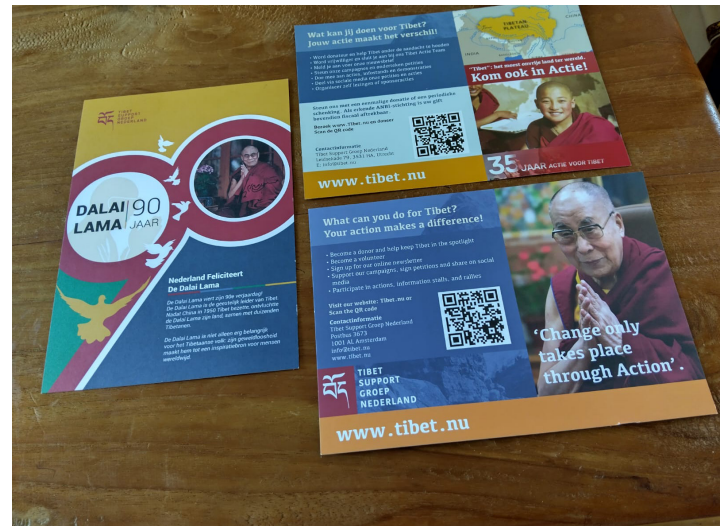
Tibet Support Groep folders en nieuwsbrief