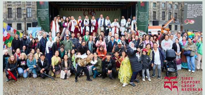
Groepsfoto van Tibetanen en supporters op de Dam in Amsterdam, 6 juli 2025

Bij de infostand van TSG-NL konden bezoekers wensen achterlaten voor de Dalai Lama, geïnspireerd op zijn vier kernwaarden: menselijke waarden, religieuze harmonie, behoud van de Tibetaanse cultuur en oude Indiase wijsheid. Toen het weer later klaarde, werd het feestelijk dansen op De Dam voortgezet.