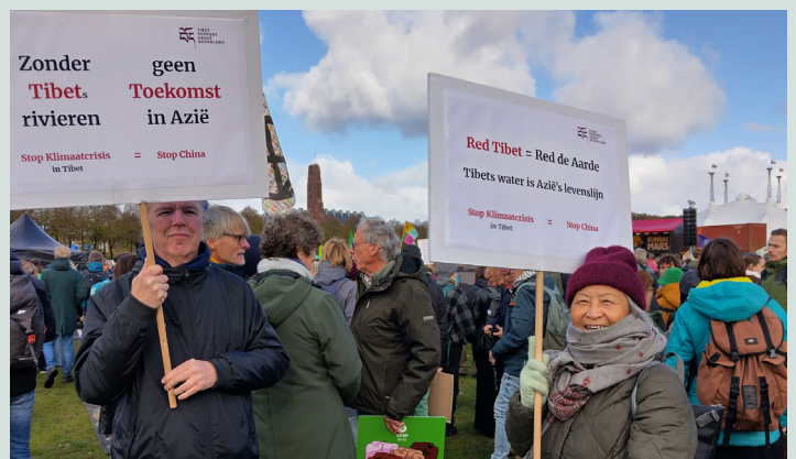
TSG-NL delegatie tijdens de protesten op het Malieveld op 26 oktober 2025

Op 26 oktober sloot de Tibet Support Groep Nederland (TSG-NL) zich aan bij de Nationale Klimaatmars op het Malieveld in Den Haag om de internationale aandacht te vestigen op de ernstige milieuvernietiging die plaatsvindt in Tibet onder Chinees bewind. De TSG-NL-demonstranten benadrukten hoe het roekeloze beleid van China—zoals overexploitatie van rivieren, mijnbouw en gedwongen hervestiging van Tibetanen—de klimaatcrisis op de “Derde Pool” van de wereld versnelt.