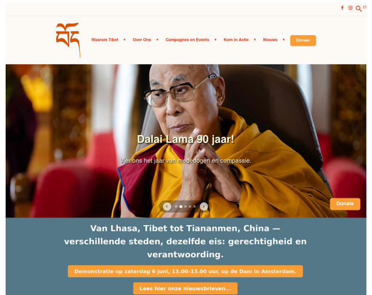
Lancering van de nieuwe website ter gelegenheid van de verjaardag van de Dalai Lama op 6 juli 2025

Om de feestelijke viering van de 90e verjaardag van de Dalai Lama op 6 juli extra luister bij te zetten, hebben we die dag laten samenvallen met de lancering van onze nieuwe website – een levendig, inspirerend platform dat onze diepe betrokkenheid bij Tibet weerspiegelt. Het is meer dan een frisse uitstraling: het is een toegangspoort tot actuele informatie, inspiratie en actie. Hier komen onze berichten tot leven en vinden onze evenementen en acties hun publiek. Zo laten we de stemmen die pleiten voor rechtvaardigheid in Tibet, en die anders ongehoord zouden blijven, luider klinken dan ooit. Met een betere toegankelijkheid, een diepere inhoud en een vernieuwde uitstraling is de website een krachtig hulpmiddel om onze achterban te verbinden, te activeren en te laten groeien.