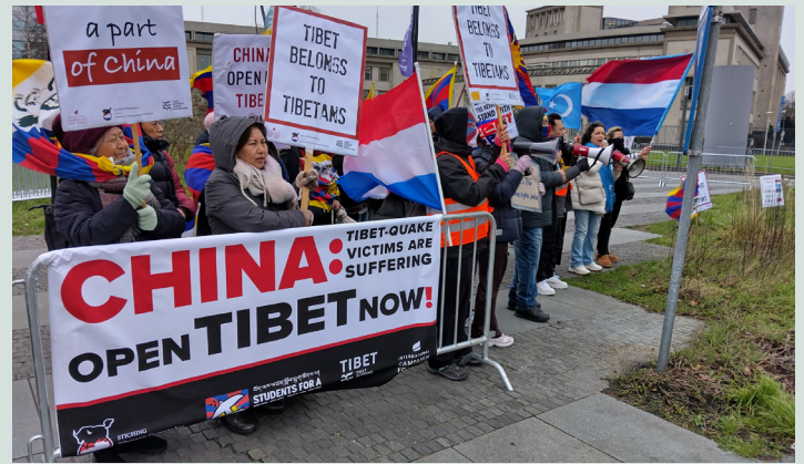
Protest tegen het bezoek van de Chinese vicepremier Ding Xue-Xiang

Op 22 januari 2025 organiseerde de Tibet Support Groep Nederland, samen met International Campaign for Tibet Europe, de Tibetaanse Gemeenschap Nederland en Students for a Free Tibet Nederland, een krachtig protest tegen het bezoek van de Chinese vicepremier Ding Xuexiang aan Nederland. De demonstratie vond plaats bij het World Forum The Hague en het Catshuis, waar minister-president Dick Schoof zijn Chinese ambtgenoot ontving. De Tibetanen, Oeigoeren, Hongkongers en sympathisanten trotseerden regen en kou om te protesteren tegen de aanhoudende repressie door de Chinese autoriteiten in Tibet, Xinjiang, Zuid-Mongolië en Hongkong. De demonstranten veroordeelden ook de beperkingen die de Chinese autoriteiten oplegden aan internationale reddingsoperaties voor de slachtoffers van de aardbeving in Tingri, Tibet.