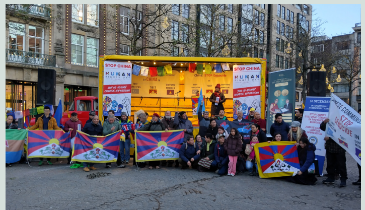
Tibetanen, Oeigoeren, Zuid-Mongoliërs, en Hongkongers demonstreren voor mensenrechten in China op de Dam in Amsterdam

TSG NL organiseerde een herdenkingsbijeenkomst ter gelegenheid van de Internationale Dag van de Mensenrechten, en van de Nobelprijs voor de Vrede die 36 jaar geleden aan de Dalai Lama werd toegekend. Een brede coalitie van organisaties bevestigde opnieuw haar inzet voor geweldloosheid, menselijke waardigheid en internationale solidariteit. De sprekers riepen de nationale regeringen en de VN- en EU-instellingen op om krachtiger op te treden tegen de grove schending van mensenrechten door China in Tibet, Oost-Turkestan, Zuid-Mongolië en Hongkong. Oeigoerse, Zuid-Mongoolse, Hongkongse en Kantoneestalige gemeenschappen sloten zich aan bij de wake op de Dam.