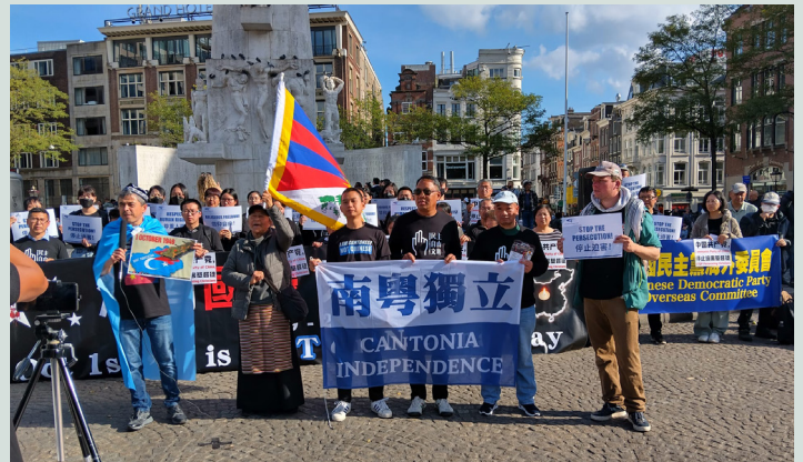
TSG-NL neemt deel aan de wereldwijde actie-dag tegen de CCP op de Dam in Amsterdam, 28 september 2025

Op 28 september nam TSG NL deel aan een wereldwijde actiedag ter gelegenheid van de oprichtingsdag van de Chinese Communistische Partij (CCP). Op de Dam in Amsterdam kwamen meer dan 150 Chinese dissidenten, Tibetanen, Oeigoeren, Zuid-Mongolen, Hongkongers en Nederlandse sympathisanten samen om te protesteren tegen de onderdrukking door de CCP. In de toespraken werd aandacht gevraagd voor de repressie in Tibet, Oost-Turkestan, Zuid-Mongolië en Hongkong, en voor de mondiale gevolgen van China's transnationale repressieve beleid. De demonstratie viel samen met de 76e verjaardag van de CCP — een dag die de deelnemers niet als viering herdachten, maar als blijk van ongebroken veerkracht en verzet.