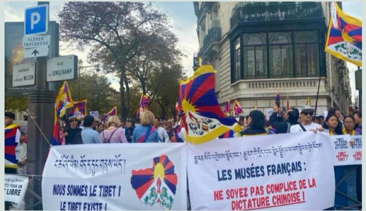
Tibetanen en Supporters demonstreren voor het museum in Parijs

China intensiveert wereldwijd zijn campagne om Tibet voortaan “Xizang” te noemen. Deze naamsverandering is geen onschuldige taalkwestie, maar onderdeel van een bredere strategie om de Tibetaanse identiteit, geschiedenis en cultuur uit te wissen. Ook internationaal groeit de invloed van deze Chinese framing. Musea en media nemen steeds vaker de Chinese terminologie over zonder kritische context, waardoor Tibet als afzonderlijke natie uit beeld dreigt te verdwijnen. Samen met het International Tibet Network riep Tibet Support Groep Nederland in een gezamenlijke campagne media, culturele instellingen en beleidsmakers op om vast te houden aan de naam ‘Tibet’ en zich niet medeplichtig te maken aan deze vorm van culturele uitwissing en Chinese propaganda.