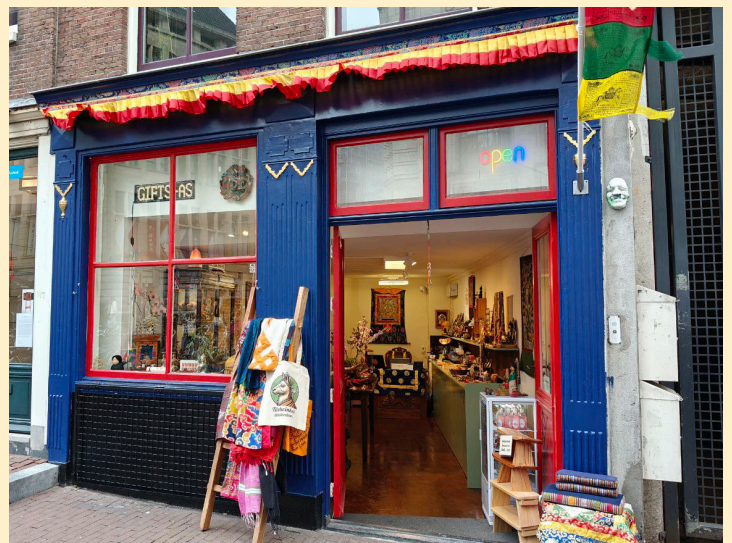
Tibetwinkel op de spuistraat in Amsterdam

Met de nieuwe eigenaar werd afgesproken dat hij de naam Tibetwinkel behoudt en een deel van de winkelvoorraad overneemt. Als tegenprestatie mag TSG NL haar informatiemateriaal, zoals nieuwsbrieven en folders, in de winkel neerleggen om met belangstellenden te delen.