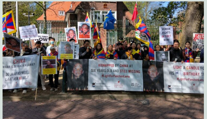
Demonstratie bij de Chinese ambassade op 25 april 2025

Op 25 april sloot de Tibet Support Groep zich aan bij een demonstratie van Tibetaanse en Zuid-Mongoolse organisaties bij de Chinese ambassade, ter gelegenheid van de 36e verjaardag van de 11e Panchen Lama. Hij wordt inmiddels al dertig jaar vermist; zijn verblijfplaats is sinds zijn verdwijning in 1995 nog altijd onbekend. De deelnemers uitten hun diepe bezorgdheid over zijn voortdurende detentie door de Chinese autoriteiten en riepen China op om hem en zijn familie onmiddellijk vrij te laten.