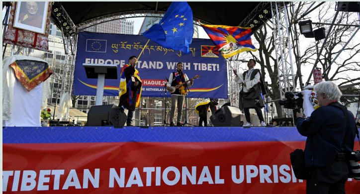
Europese Solidariteit Manifestatie ter herdenking van de Tibetaanse volksopstand van 10 maart 1959.

Meer dan 4000 mensen deden mee aan de manifestatie en versterkten zo de internationale solidariteit met Tibet. Deze zeer geslaagde Europese solidariteitsmanifestatie werd georganiseerd door Tibet Support Groep Nederland, ICT Europe, de Tibetaanse Gemeenschap en Students for a Free Tibet NL.