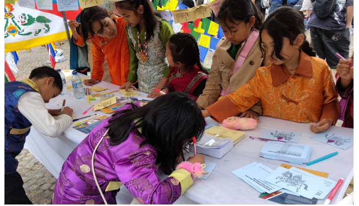
Kinderen kleuren wensen voor de jarige Dalai Lama in. Dam in Amsterdam, 6 juli 2025

versierde stand trok veel bezoekers, die op deze bijzondere dag een verjaardagsboodschap voor de Dalai Lama konden schrijven. Op 10 december hadden wij een informatiestand op de Dam en verspreiden wij folders en nieuwsbrieven onder het publiek. Dankzij de grote belangstelling van het algemene publiek konden wij veel informatie verspreiden en veel nieuwe mensen bereiken.