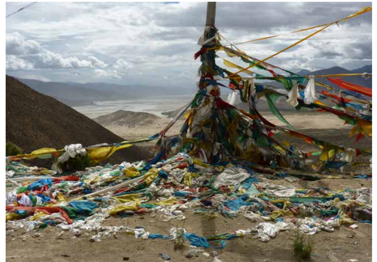
Bergtop, dicht bij de hemel, Tibet.

Klaterende bergbeekjes glinsteren in de zon en soms is daarin een mechaniekje aangebracht en wordt gebruik gemaakt van de kracht van het stromende water. Wij, in de Lage Landen kennen dat natuurlijk ook al eeuwen. Molens, ouderwetse wind- en watermolens die graan, verfstoffen en vodden (ver) maalden en nu de moderne windmolens, die ter land en ter zee energie opwekken.